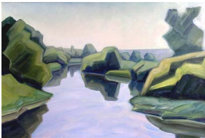
Ю. Кудрявцев. Клязьма у Бездедово. 1979. Холст, масло. 45x60.

множеств производных цветов – с нахождением для каждой живописной работы, будь то картина или пейзажный этюд, собственного колористического и формального, единого пластического ключа – своей "цветовой композиции".