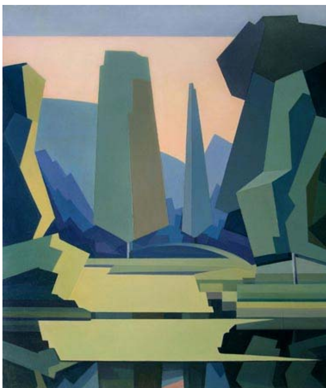
Ю. Кудрявцев. Вечер в парке. Седнев. 1988. Холст, масло. 57x79.