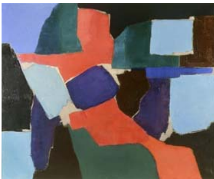
Ю. Кудрявцев. Хлебное поле. 1996. Холст, масло. 76x121.