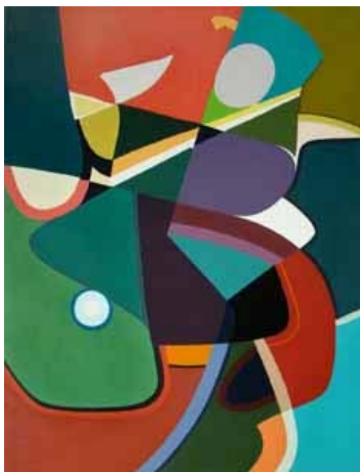
Ю. Кудрявцев. Женщина в полнолуние. 1999. Холст, масло. 100x75.

Однако когда художник стремится создать чисто абстрактные живописные образы, импровизация предъявляет к нему самые высокие требования, заставляя добраться до глубины своих чувств, цветоощущения, пластической интуиции, ассоциативных идей и воспоминаний, – и тогда отвлечённая, "беспредметная" живопись становится выразительнейшим и одухотворённым предметом искусства.