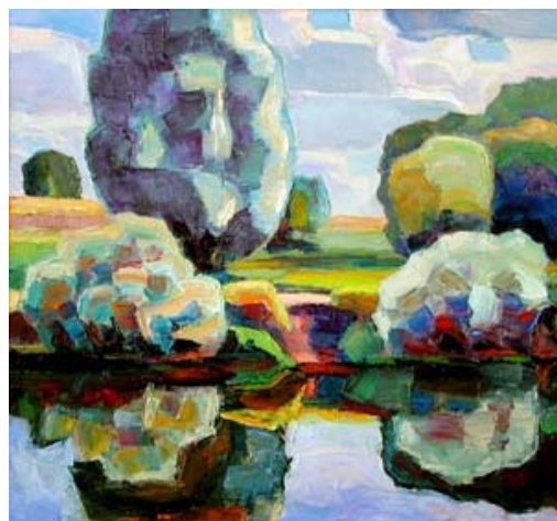
Ю. Кудрявцев. Кусты-самоцветы. 2001. Холст, масло. 35x37.

Выбирая пейзаж для работы на природе, художник вглядывается в каждый красивый уголок, но находит нечто "своё", чаще всего исходя из композиции, которая живёт в конкретном состоянии пейзажа, и заранее веря, что цвет во всей полноте проявится во время его живописных трудов – стоит лишь положить на природу и своё цветоощущение. И, пожалуй, это именно так, поскольку живописец даже не-