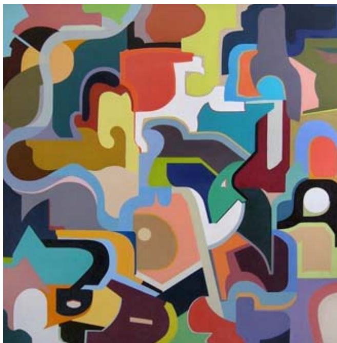
Ю. Кудрявцев. Горячая русская душа и самокопание. 2002. Холст, масло. 100x95.

И в абстрактных, и в реалистических работах "симхромизм" стремится к живописной и структурной насыщенности и напряженности, к индивидуализму цветоформ, исключая такие известные приёмы и средства живописи, как монохромность, доминантные цветовые фрагменты и фоны, мазковая, точечная или линейная дробность письма с её неизбежными цветовыми и тональными повторами, а также краткие и эффектные, "популярные" и заимствованные цветовые комбинации, открытый цвет, плавные, "пилящие" переходы цветов и любые повторы вообще, – т.е. всё, что стирает живописные грани и ритмы, нарушает либо обедняет цветовую гармонию, лишает её уникальности красочных связей, многозначной цветопластической драматургии и структурированности. Это – "одухотворённая пластика цветовых отношений" в сложных гармониях, как правило,